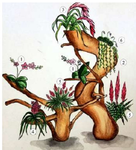
Рис.3. Схема вертикального інтер'єрного рутарія. 1. Phalaenopsis. 2. Senecio. 3. Billbergia. 4. Tillandsia. 5. Vriesea. 6. Echeveria.