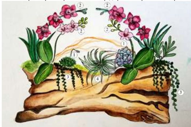
Рис.2. Схема горизонтального інтер'єрного рутарія 1. Echeveria 2. Phalaenopsis. 3. Senecio. 4. Tillandsia.

Навіть за умови однакового набору рослин, кожен раз композиція буде виглядати по різному цікавою завдяки неповторному та оригінальному деревному елементу.